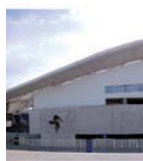
Estádio do Dragão

Estádio do Dragão e Museu do FC Porto. Dragão stadium and FC Porto museum.