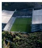
Estádio Municipal de Braga