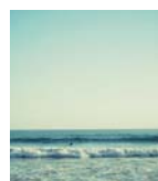
Praia de Espinho

Restaurantes (peixe) e bares. Restaurants (fish) and pubs.