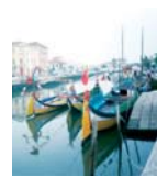
Ria de Aveiro