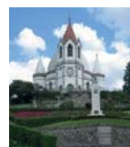
Santuário de Nossa Senhora da Piedade

Festas de São Martinho. São Martinho festivities.