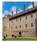
Paço dos Duques de Bragança