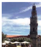
Torre dos Clérigos