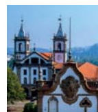
Mosteiro de São Bento

Jesuítas; limonetas. Puff pastry with custard cream filling and glaze.