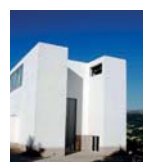
Igreja de Santa Maria

Anho assado com arroz no forno; verdinho de lampreia; pudim de pão; sopas secas; regueifa; fatias do freixo e os biscoitos da fábrica duriense. Lamb roast with rice; lamprey; bread pudding; a sweet of layers of bread with sugar and cinnamon; a sweet loaf; sponge filled with custard cream and glazed and 'fábrica duriense' biscuits.