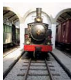
MNF - Núcleo Museológico de Lousado

Museu Nacional Ferroviário - Núcleo Museológico de Lousado. Entrada gratuita. National railway museum - Lousado section. Free entrance.