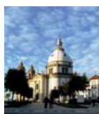
Santuário do Sameiro