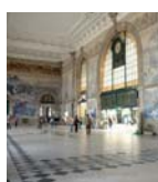
Estação de Porto São Bento