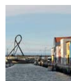
Bairro da Beira-Mar