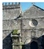
Mosteiro de São Pedro

Rota do Românico; Ermida da Nossa senhora do Vale; Mosteiro de São Pedro de Cête, Mosteiro do Salvador de Paços de Sousa.