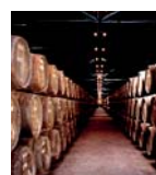
Caves Vinho do Porto