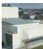
Casa das Artes

Carnaval; Festas Antoninas; Feira Grande de São Miguel. Carnival festivities; Antoninas festivities; São Miguel fair.