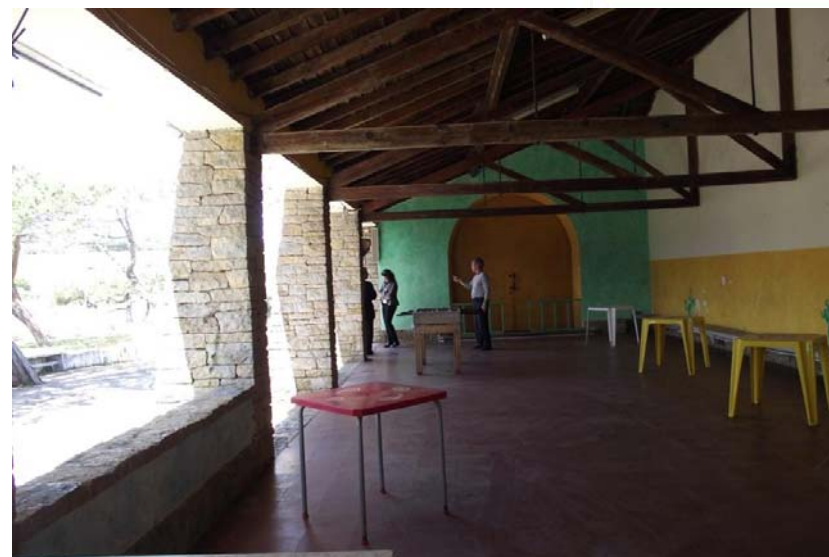
Hall + capela