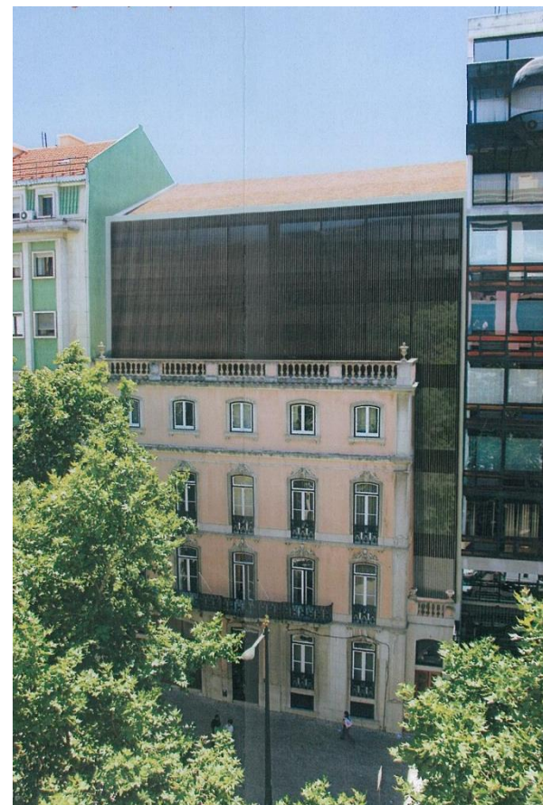
Proposta de ampliação